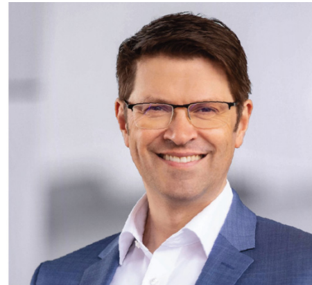
Oliver Zipse Président du Conseil de direction de BMW AG